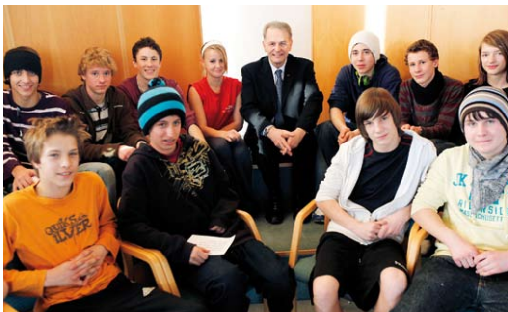
Jacques Rogge zu Besuch im Reithmangymnasium Innsbruck. Der IOC-Präsident nahm sich viel Zeit und sprach über die Olympische Bewegung, seine persönlichen Erfahrungen und beantwortete geduldig Fragen der Schülerinnen und Schüler. Seine Botschaft: „Nützt die freie Zeit zur Ausübung verschiedener Sportarten und nützt die Chancen, die euch das Leben gibt!“

INNSBRUCK 2012 Host City for the Youth Olympic Games